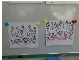
△己書 講師 兼子考子氏 (第2、第4火曜日)

己書などの創作的活動やパソコンなどの社会適応訓練等があり、それぞれ活動曜日が決まっておりますボランティアの講師の指導が受けられる場合があります。講師の活動日以外であっても自主的な活動が可能でご都合に合わせてお好きな活動をご利用いただけます。