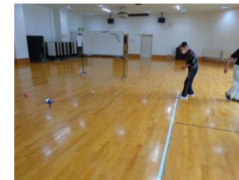
△軽スポーツ 講師なし (金曜日)