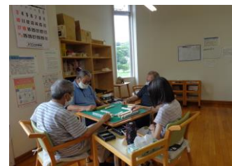
△麻雀 講師なし (火曜日を除く毎日)

※カラオケ講座については、現在コロナウィルス感染防止のため、講座休止中となっています。