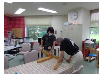
△制作 木工等 講師 なし (火曜日、木曜日)