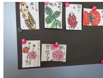
△絵手紙 講師 安井裕之氏 (月1回、火曜日)