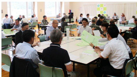
2018年のきずな推進委員会の様子

今年度は2022年から2026年まで取り組む第4期きずな計画の策定年度です。きずな推進委員会による検討や市民アンケート調査等を用いながら、市が進める「地域福祉計画」との一体的な策定を行います。