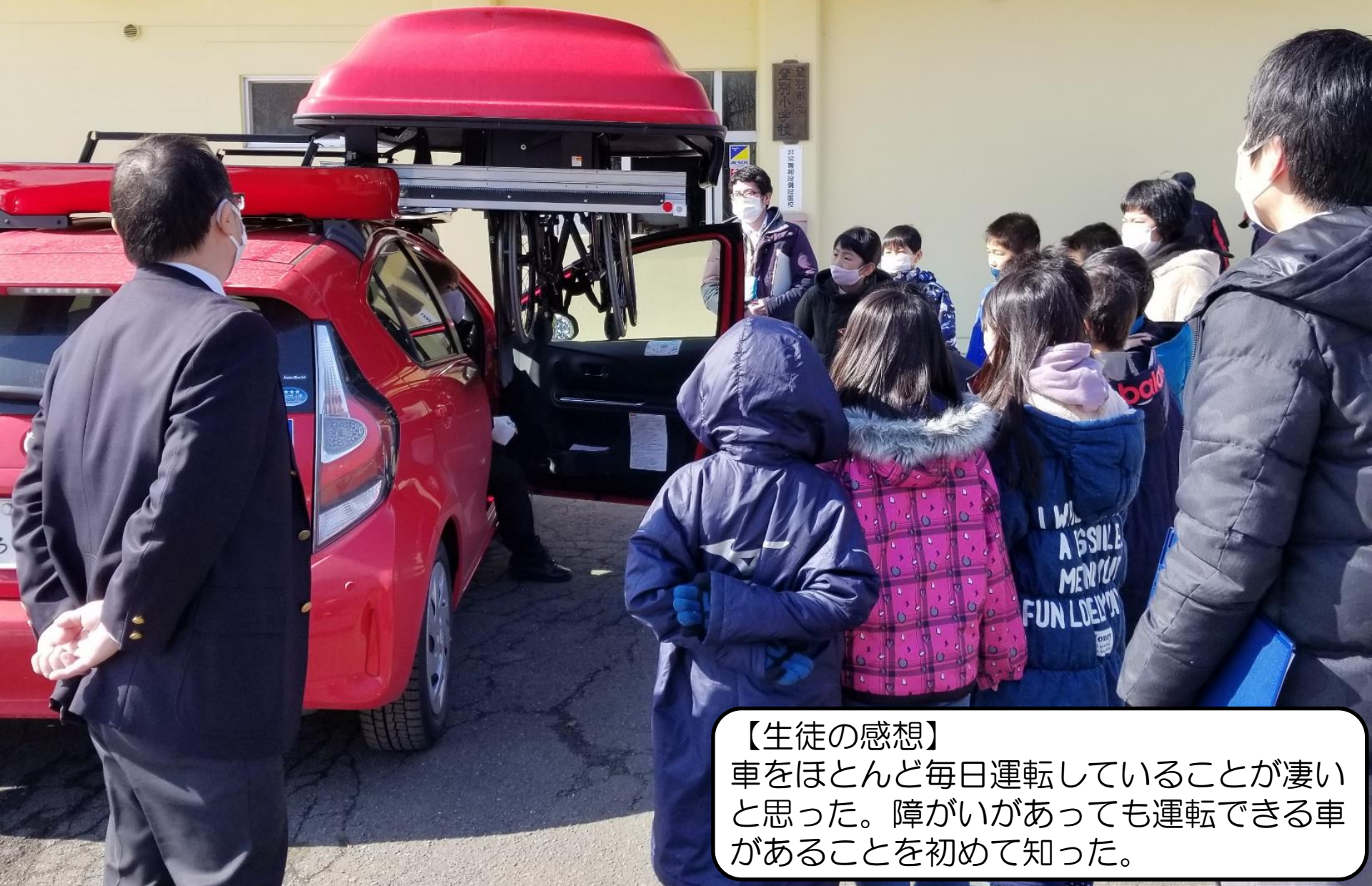
今さんの自家用車（車椅子ユーザーが運転できる車）を見学している様子

【生徒の感想】 車をほとんど毎日運転していることが凄いなと思った。障がいがあっても運転できる車があることを初めて知った。