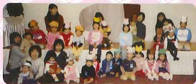
H15.1.25交流会 “てぶくる”みんなが主役!