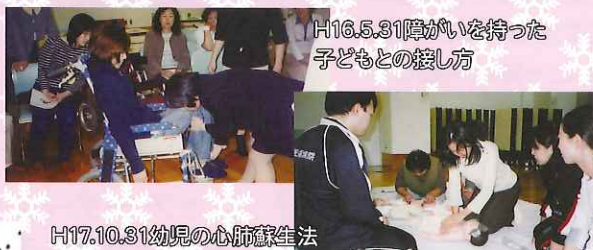
H16.5.31障がいを持った子どもとの接し方