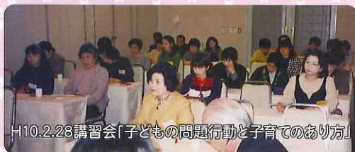
H10.2.28講習会「子どもの問題行動と子育てのあり方」