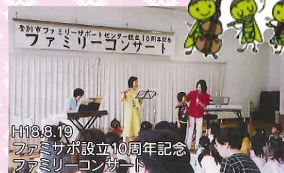
H18.8.19ファミサポ設立10周年記念ファミリーコンサート