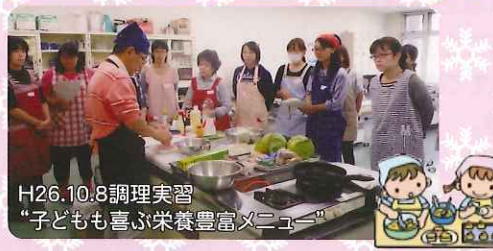
H26.10.8調理実習 “子どもも喜ぶ栄養豊富メニュー”

会員のみなさまの幾重にも広がる笑顔の輪に支えられ、20周年の節目を迎えることができました。設立月である8月には、依頼会員数が設立時の10倍の800名、提供会員171名、両方会員151名、計1122名の会員数となりました。