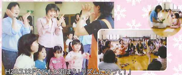
H20.7.12「子どもと遊ぼう!リズムにのって!」