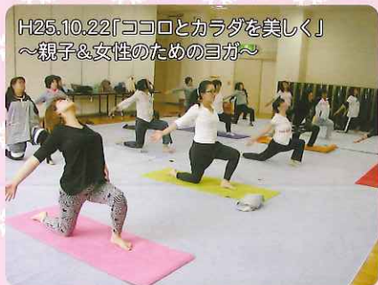
H25.10.22「ココロとカラダを美しく」 ～親子&女性のためのヨガ～