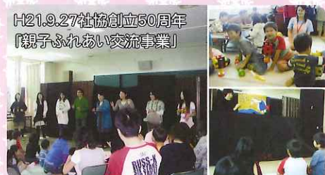
H21.9.27社協創立50周年「親子ふれあい交流事業」