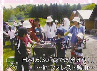
H24.6.30「森であるほう!」 ～in フォレスト鉱山～