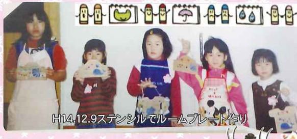
H14.12.9ステンシルでルームプレート作り