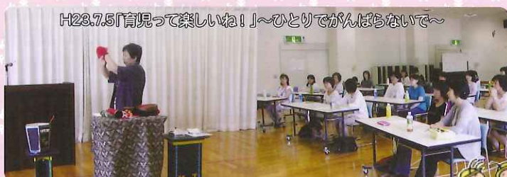
H23.7.5「育児って楽しいね!」～ひとりではがんばらないで～