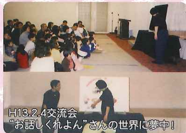
H13.2.4交流会 “お話ししてくれよん”さんの世界に夢中!