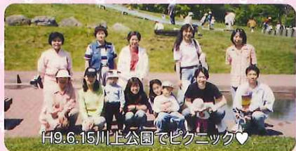
H9.6.15川上公園でピクニック

平成8.8.1 北海道で最初のファミリーサポートセンターとして発足。12/1発会式。依頼会員80名、提供会員19名、両方会員22名でのスタートです!