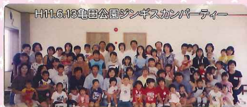
H11.6.13電田公園ジンギスカンパーティー