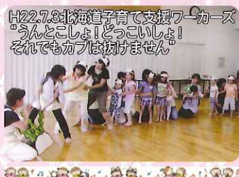
H22.7.8北海道子育て支援ワークショップ うんとこしょ!どっこいしょ! それでもカブは抜けません