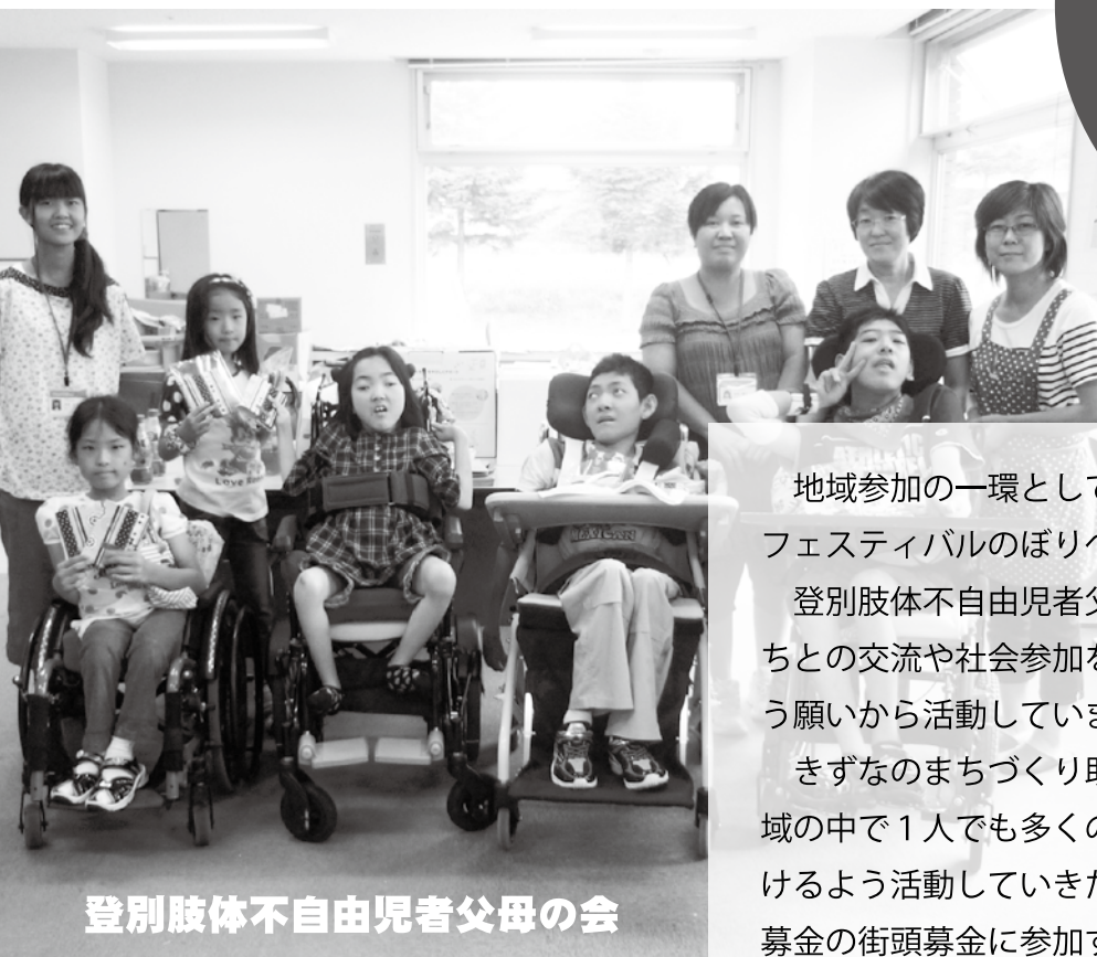
登別肢体不自由児者父母の会

地域参加の一環として、子どもたちの手作り雑貨をふれあいフェスティバルのぼりべつ2012で販売します。