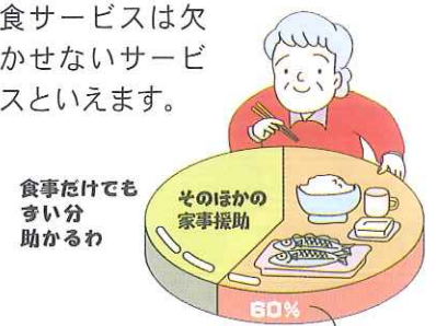
〈家事援助サービスのニーズ〉 食事の用意

現在、家事援助サービスを利用している利用者の6割が食事の用意を要望しています。このことから食事に対するニーズの高さが分かりますが、ヘルパー派遣での食事の調理に要するコストは、決して安くはありません。これらの家事援助サービスの多くは、配食サービスで賄えるものだと考えます。効率的な在宅介護サービスの提供のためにも、配食サービスは欠かせないサービスといえます。