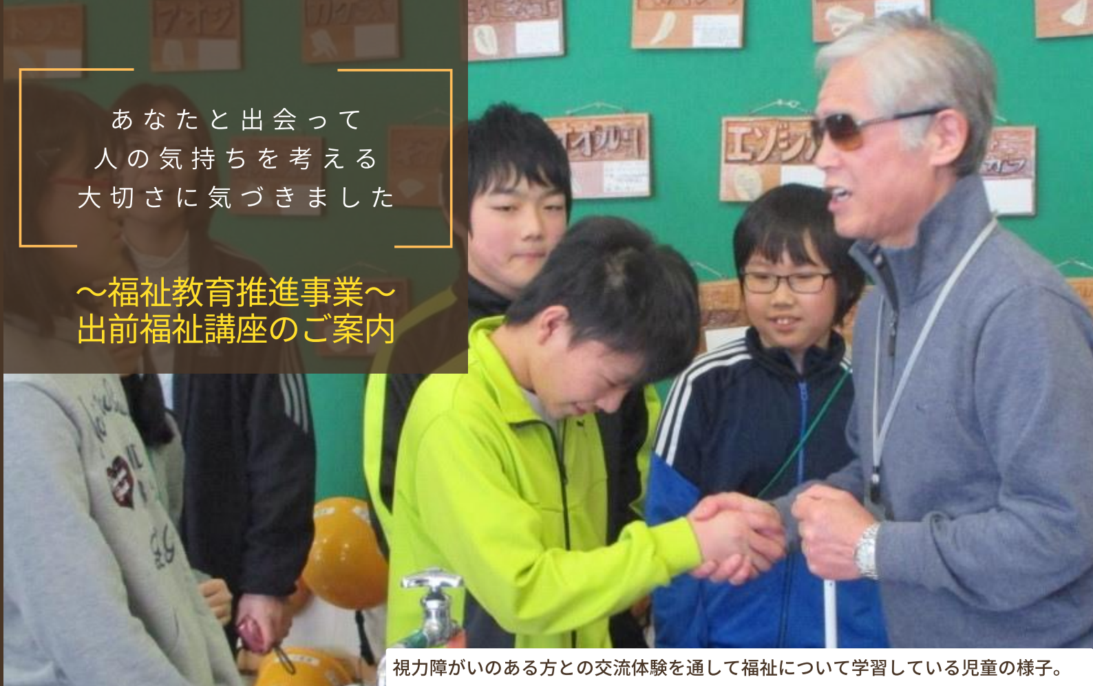
視力障がいのある方との交流体験を通して福祉について学習している児童の様子。