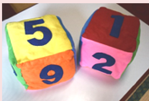
▲20cm×20cmの フェルトの手作りサイコロ