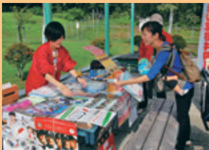
▲胆振地区少年軟式野球大会での募金活動

【イベント名(実施団体)】きずなシンポジウム(登別市共同募金委員会)、わくわく広場のぼりべつ2014(わくわく広場のぼりべつ実行委員会)、地域型ボランティアセンター(登別市共同募金委員会)、あかしや町内会夏祭り(あかしや町内会)、鷺別納涼ビールまつり(鷺別商店会・ふるさと鷺別を考える会)、第51回登別地獄まつり(登別市共同募金委員会)、ふれあいフェスティバル2014のぼりべつ(登別市共同募金委員会)、胆振地区少年軟式野球大会(登別市共同募金委員会)、技能祭(職業訓練法人登別職業訓練協会)、第8回寄酔祭～秋の陣～(登別中央飲食店組合)、第8回鷺別海岸海洋浴ウォーキングまつり(鷺別海岸イベント実行委員会)、第37回鷺別地区チャリティー市民演芸会(鷺別地区チャリティー市民演芸会実行委員会)、第37回登別地区チャリティー市民演芸会(登別地区チャリティー市民演芸会実行委員会)、登別消費生活展示(登別市ボランティアセンター)