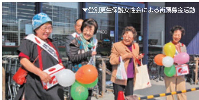
▼登別更生保護女性会による街頭募金活動