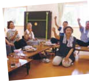
←ふれあいいきいきサロン 「おいでやサロン」の一角