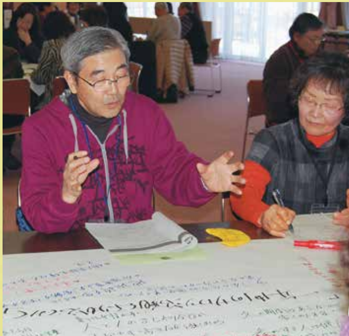
↑ サロンサポーター連絡会の演習風景