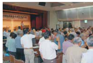
↑ 鷺別地区ビールパーティー

益金は、社会福祉基金に積み立てられ、きずな事業を安定・継続的に実施するための財源に活用しています。