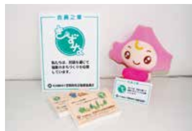
↑ 会員之章、ステッカー 北海道社協のマスコット“ほっとちゃん”