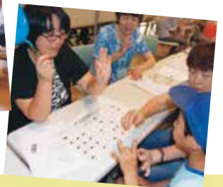
地域型ボランティアセンター→ (手話体験の様子)