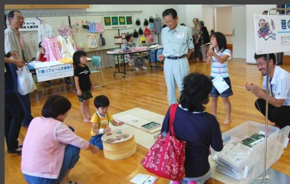
▲昔の遊び体験の様子

多くのボランティア団体の皆さんにご協力頂き、手話体験・点字点訳体験・昔の遊び体験・布のマスコット作り・介護衣類の展示販売・ガイドヘルプ体験・車椅子体験・古切手の整理体験 等を行いました。